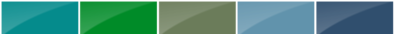
TURQUOISE RAL 5018