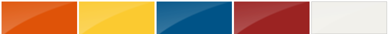
ORANGE RAL 2009