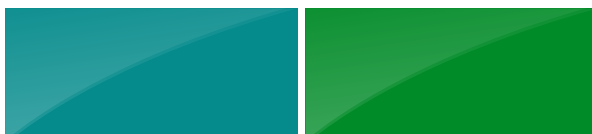
TURQUOISE RAL 5018