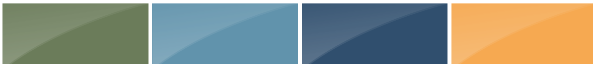
VERT RÉSÉDA RAL 6011