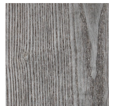
FRÊNE MODIFIÉ THERMIQUEMENT, VIEILLI